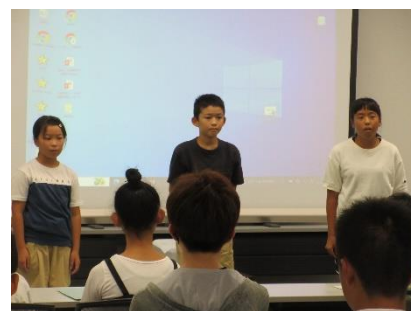
いじめ防止フォーラム

さて、夏休み期間中、もうひとつ嬉しいことがありました。7月31日(水)に加東市役所で市内小中学生によるいじめ防止フォーラムがあり、南小学校から6年生の児童会役員が参加し、自然学校へ行く5年生への「てるてる坊主メッセージ」等本校の温かい取組を紹介しました。他校の小中学生の前でも堂々と発表できました。その様子を見て、これまで教室や全校授業・全校集会の場で鍛えられてきた「話す力」を感じました。