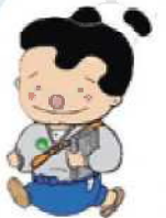
加東市マスコット 「加東伝の助」