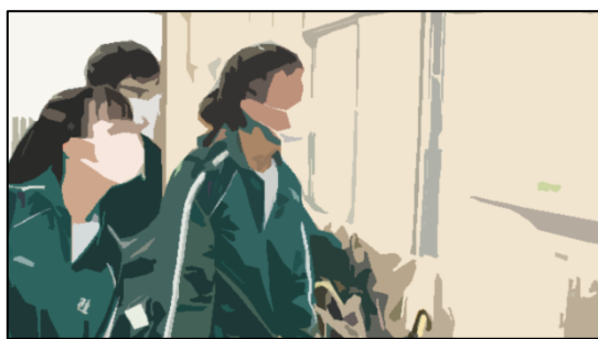
★3年生新クラス発表★

今年度の学校教育目標「向上心～夢を抱き 自ら学ぶ 心優しく たくましい生徒の育成～」を達成し、「なりたい自分に、なるために」社中学校全体で挑戦していきましょう。