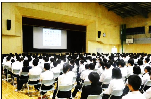
★ 情報モラル講演会 ★

子どものインターネット利用が増える中、悪ふざけや冗談のつもりでとった安易な行動が犯罪であったり、自分の技術を自慢したくて違法行為になることをしてしまっているケースも少なくないそうです。